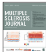
Multiple Sclerosis Journal Impact Factor: 4.822*

Ranked: Clinical Neurology 22 out of 192