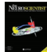
The Neuroscientist Impact Factor: 6.837*

Ranked: 21/252 in Neurosciences 11/192 in Clinical Neurology